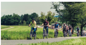
Aktiv- und Teamspirit Gruppenreisen