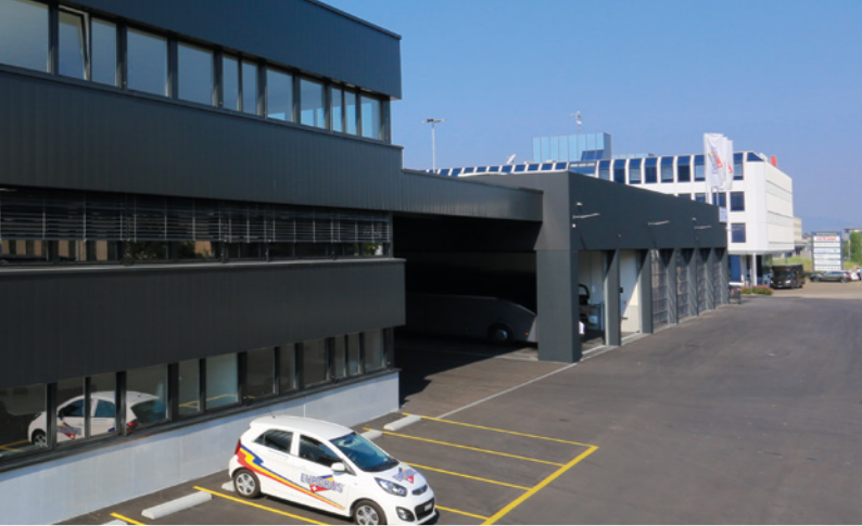
es Bürogebäude mit Schulungsräumlichkeiten.