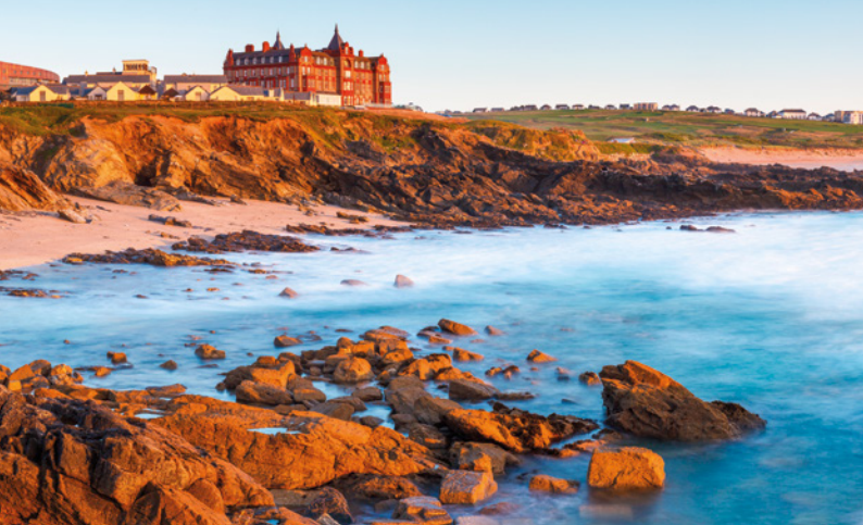
Little Fistral Beach Newquay Cornwall, England