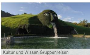
Kultur und Wissen Gruppenreisen