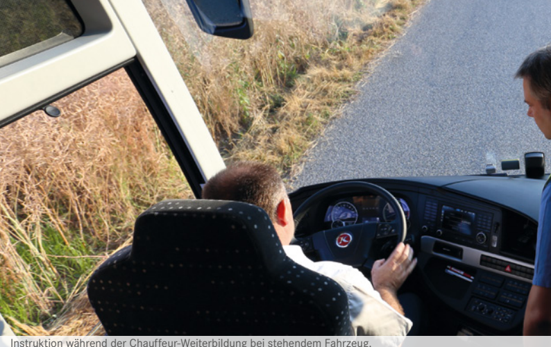
Instruktion während der Chauffeur-Weiterbildung bei stehendem Fahrzeug.