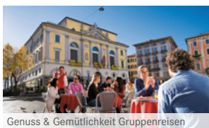
Genuss & Gemütlichkeit Gruppenreisen