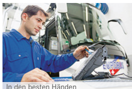
In den besten Händen

Das EUROBUS Aus- und Weiterbildungszentrum ist ISO-zertifiziert und arbeitet nach den neuesten Erkenntnissen aus der Erwachsenenbildung.