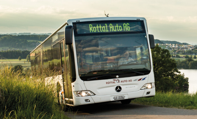
Standardbus der Rottal Auto AG unterwegs