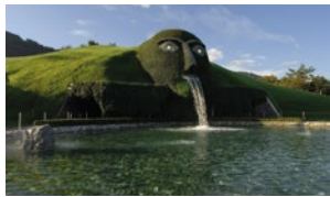
Kultur und Wissen