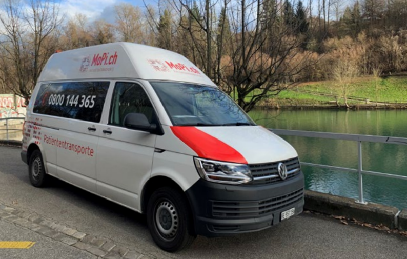
MoPi-Fahrzeug für liegende Patiententransporte