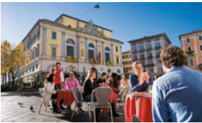
Genuss und Gemütlichkeit