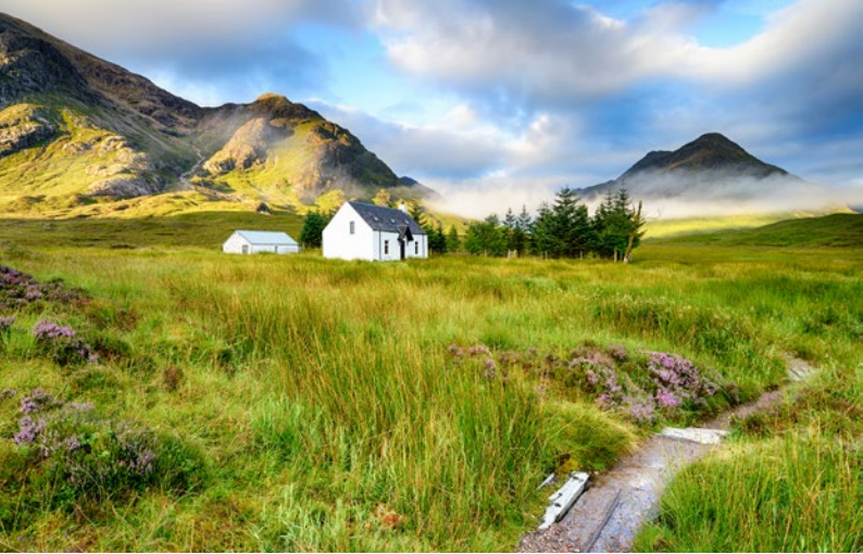
Cottage in den Highlands, Schottland