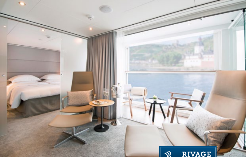
Suite eines Emerald Flussschiffs